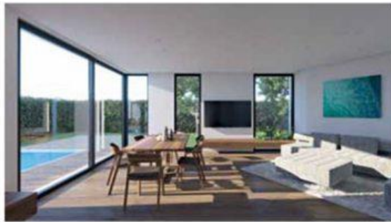
VILA TRNOVO: avtor Magnet design (Robert Klun), render Magnet design