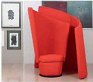
KLUN SILENT CHAIR: dizajn Jurij Dobrila in Klun ambienti