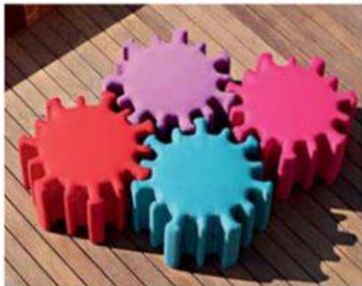
KLUN CORONA CHAIR: dizajn Robert Klun