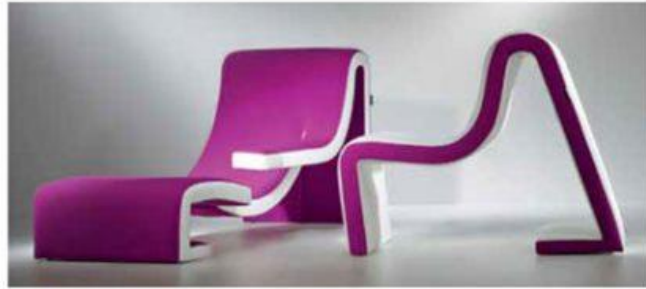
KLUN LINEARR: dizajn Robert Klun, foto Aljoša Videtič