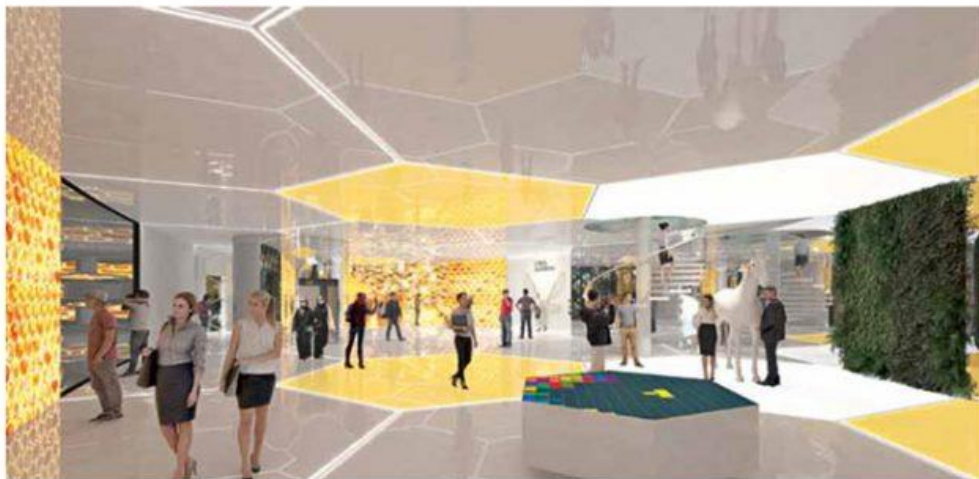
EXPO 2020 DUBAJ: avtor Magnet design (Robert Klun), render Magnet design

KO SE FORMA RODI, JE TO PRAV POSEBNO DOŽIVETJE. IZLIV IDEJ, PODOB IN NEZAVEDNEGA, KI JE ZORELO.