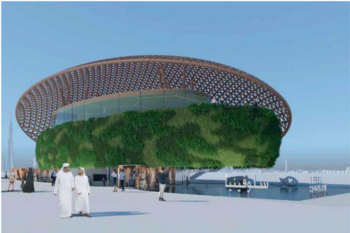
EXPO 2020 DUBAJ: avtor Magnet Design (Robert Klun), render Magnet design